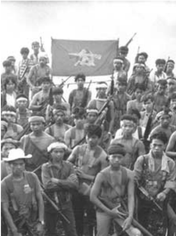
NPA တပ်ဖွဲ့ဝင်များ

* NPA ဟာ လက်နက်ကိုင်ပြည်သူ့စစ်ပွဲကို ကိုယ့်အားကိုယ်ကိုးရေးမှုအရ အကောင်အထည်ဖော်ဆောင်ရွက်ခဲ့တာပါ။ ၎င်းရဲ့ အင်အားကြီးထွားလာမှုနဲ့ တိုးတက်ရှေ့တန်းရောက်လာမှုဟာ ပြည်သူ့လူထုရဲ့ ပါဝင်မှုနဲ့ ထောက်ခံမှုကြောင့် ပါပဲ။